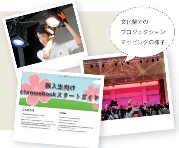
文化祭での プロジェクション マッピングの様子

コロナ禍で入学直後に休校期間が続く、Chromebookの使い方についてクラスメイトから質問がたくさん来しました。同じような質問が多く、他にも困っている人がいるだろうと思い、生徒専用のポータルサイトを立ち上げました。先生にも許可をいただき、一緒に運営しています。今後も在校生のサポートのため、サイトの整備に努めたいです。そして部活動ではステージでより高度なプロジェクションマッピングに挑戦し、技術を磨きたいです。